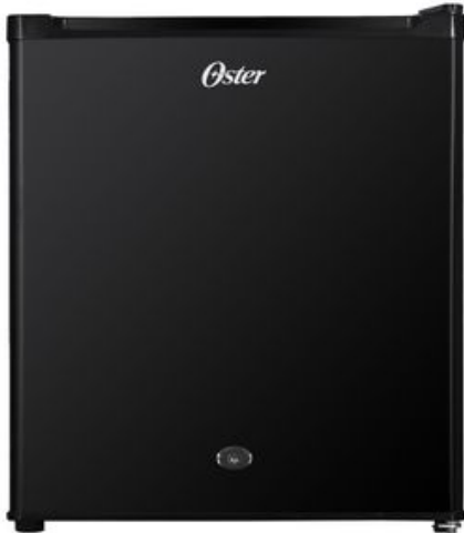
Frigobar OSTER 46L OS-PMB46BB Negro Oster 1001679185